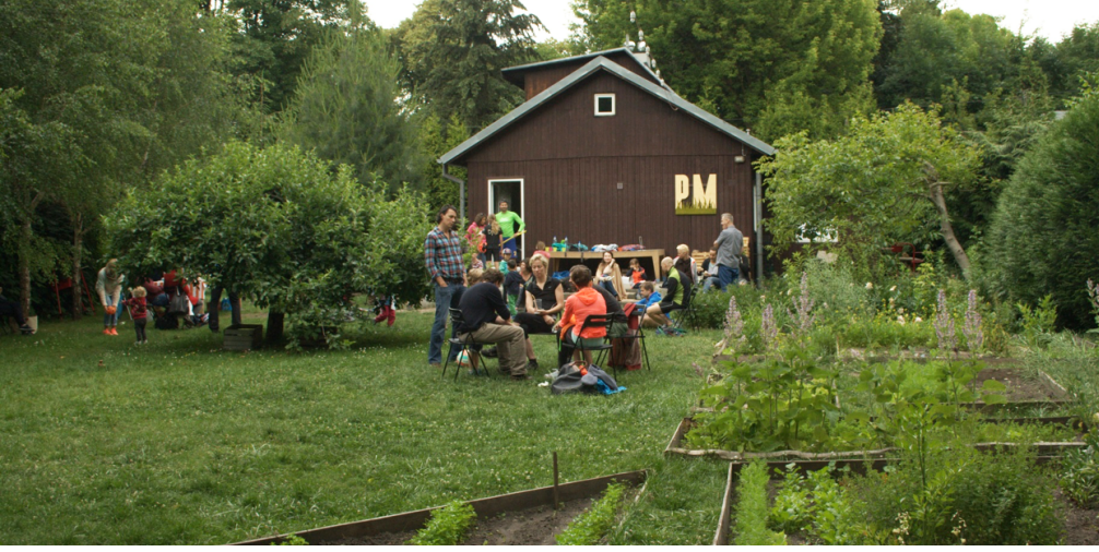
Kuva 4 - Puutarhahuhlat, Queen Bona yhteisöpuutarha, Jazdów, Warsaw.