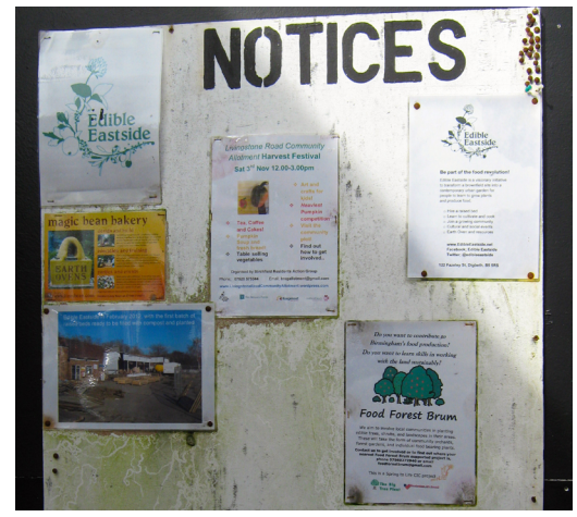
Kuva 5 - Ilmoitustaulu tiedottamista varten, Edible Eastside, Birmingham.