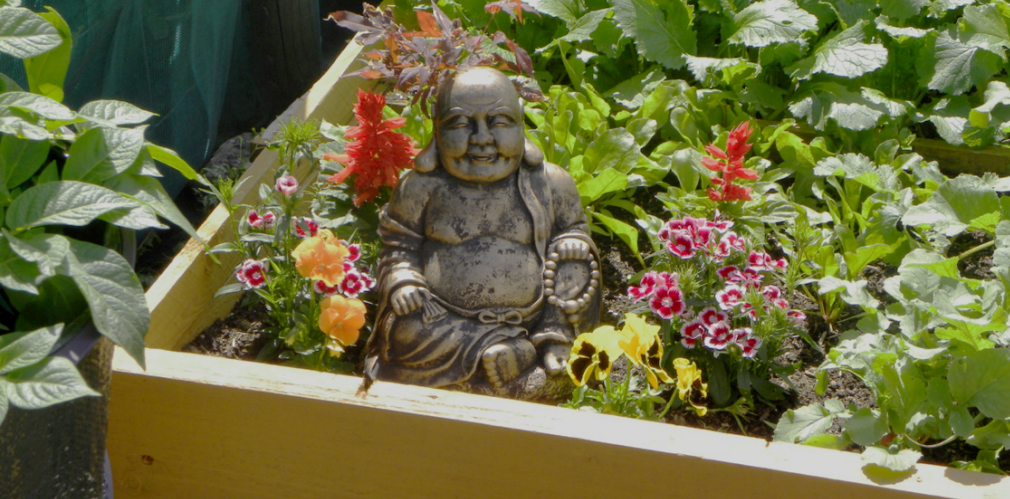
Kuva 2 - Yksilöity palsta, Weaver's Square kaupunkipuutarha, Dublin.