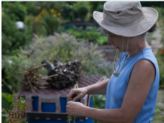
Kuva 6 - "Tykkään kasvattaa kasveja rykelmissä ... ja sekoittaa niitä keskenään ... epätavallisia kasveja ... se näyttää paremmalta ja luonnollisemmalta ... kuin metsä tai villi niitty", (Viljelijä Walsall Roadin viljelyalueella).