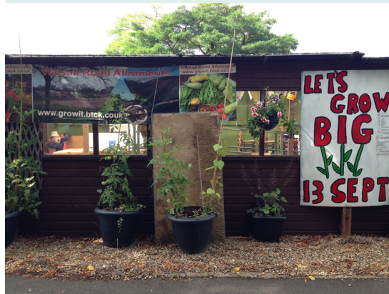
Image 7 - Yhteistila tapahtumia ja tekemistä varten, Walsall Roadin viljelyalue.