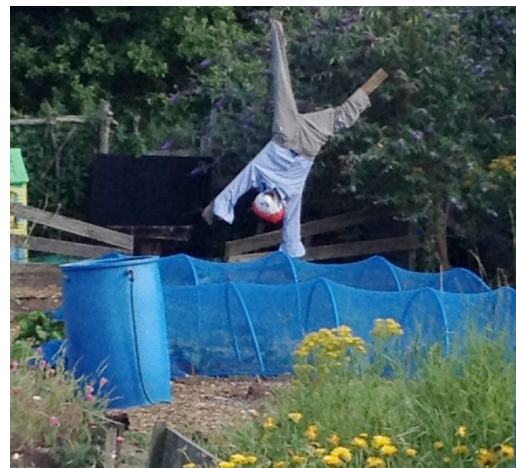
Kuva 3 - Yksilöity palsta, Moor Green palsta-alue, Birmingham.