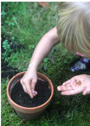
Puutarhoissa nuorimmatkin löytävät monia mahdollisuuksia kokeilla uusia asioita ja kerätä kokemuksia luonnosta.

tion, yhteisöön kuulumisen ja luontokokemuksen. Kysyttäessä, mitä muuta hänen pitäisi tehdä terveytensä hyväksi, yli 80-vuotias, erittäin aktiivinen ja intohimoinen puutarhuri sai perhelääkäriltään vastaukseksi: "Jatka sitä, mitä teet".