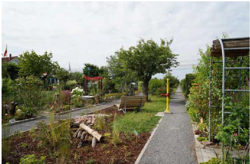
Puutarhojen tulisi olla pysyvä osa kaupunkisuunnittelua.

Kaupunki- ja aluesuunnittelijoiden on lähitulevaisuudessa varauduttava siihen, että Saksan vauraisiin taajamiin ja keskisuuriin keskuksiin tulee jatkuvasti uusia asukkaita. Yksi suurimmista haasteista tulee olemaan riittävien ja laadukkaiden viheralueiden tarjoaminen huolimatta asuinalueiden kasvavasta kysynnästä.