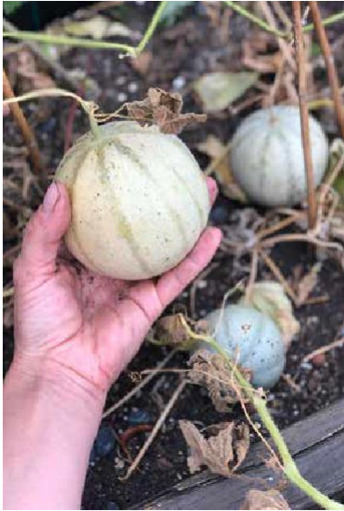
Omenasta sokerimeloniin: pienviljelypuutarhojen arvo kotimaisten elintarvikkeiden tarjoamisessa on mittaamattoman suuri.

ings. Pensasaitojen ja puiden karsiminen ja esimerkiksi vaihtuvat istutukset ovat hyvin työläitä. Uusien lähteiden puuttuessa niiden hoitoa julkisilla viheralueilla karsitaan tai se rajoitetaan muutamiin esittelykohteisiin. Toinen seikka on viheralueiden ekologinen ylläpito. Vaikka se on lisääntymässä kunnissa, on julkisten viheralueiden ylläpidossa työskentelevien työntekijöiden koulutus ja täydennyskoulutus vasta kehitteillä. Asuntoyhteisöjen viheralueilla, joilla on toisinaan laajoja nurmikoita, joilla on leikkipaikkoja lapsille ja myös pienempiä ruoho- ja puuistutuksia, olisi toisaalta mahdollista, että asukkaat käyttäisivät niitä huomattavasti enemmän joko virkistystarkoituksiin tai puutarhanhoitoon.