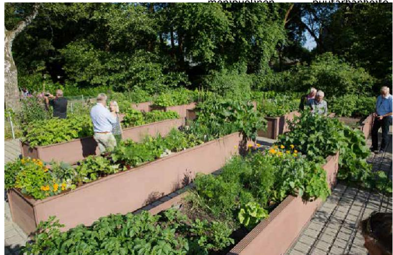
Yhteisöpuutarhat pienpalstaviljelyalueilla kutsuvat puutarhanhoitoon ja uusien asioiden kokeilemiseen - matkan varrella voi solmia uusia kontakteja.

Voittoa tavoittelemattomat kerhot ja yhdistykset rahoitetaan pienillä jäsenmaksuilla, ja niiden toiminta perustuu suurelta osin vapaaehtoisuuteen. Työtehtävät ovat erittäin monipuolisia ja riippuen jakelupuutarhasta.